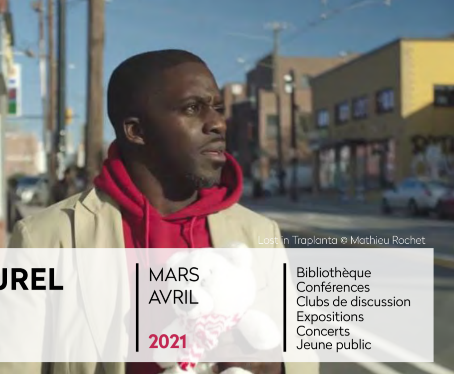
Lost in Traplanta